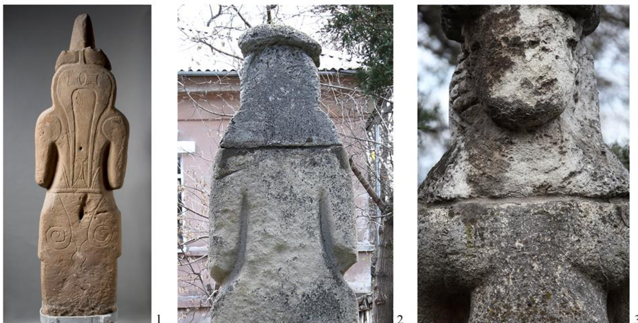
Рисунок 4. Отдельные детали иконографии: 1 – тыльная сторона половецкого изваяния из Эрмитажа; 2 – тыльная сторона бюста изваяния из Николаева; 3 – лицо и гривны бюста изваяния из Николаева (1 – фото Д.А. Боброва; 2, 3 – фото А.В. Евглевского).

Таким образом, представленные факты говорят о том, что «археологическое свидетельство действовавшего в степях института женщин-воительниц» (Плетнева, 1998, с. 534) таковым не является. Изваяние, хранящееся в Николаевском областном краеведческом музее, представляет собой обычную скульптуру половецкого воина, обезображенную подделкой новейшего времени.