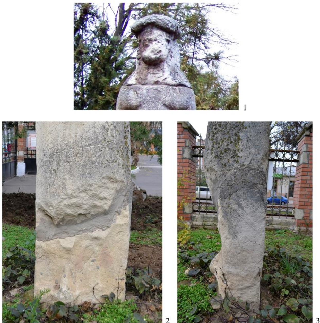
Рисунок 2. Половецкое изваяние из Николаевского краеведческого музея: 1 – щель между бюстом и фигурой; 2 – низ лицевой стороны; 3 – изображение сабли на боковой стороне постамента.

Украшавшие головной убор «рога» (рис. 3, 3) на подделке явно похожи на букли парика (рис. 3, 4). Боковые стороны накидки (или лопасти) на тыльной стороне головы поддельного бюста не имеют никакого продолжения, как это обычно для такого типа скульптур (рис. 4, 1). Здесь же – просто плоская гладкая поверхность без каких-либо изображений (рис. 4, 2). Гривны также мастеру явно не удалось, не говоря уже про лицо (рис. 4, 3). Любому специалисту, занимающемуся половецкими статуями, без каких-либо дополнительных анализов видно, что фальшивая женская «половецкая» голова с плечами прикреплена к настоящему половецкому изваянию, изображающему мужчину-воина. Думаю, что бюст, скорее всего, был изготовлен в кон. XVIII – нач. XIX вв. по заказу какого-нибудь помещика для украшения усадьбы «целой» древней скульптурой.