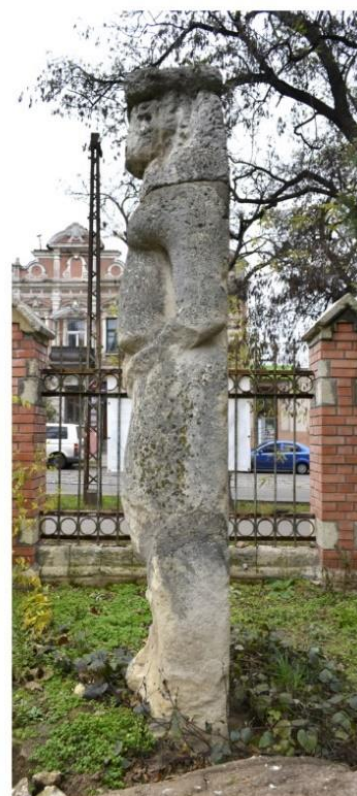
Рисунок 1. Половецкое изваяние из Николаевского краеведческого музея: 1 – по С.А. Плетневой; 2-5 – общий вид спереди, сзади, в профиль.

названная исследовательницей «амазонкой» (Плетнева, 1974, с. 74), «единственной дошедшей до нас статуей женщины-амазонки (с саблей, колчаном, луком)» (Плетнева,