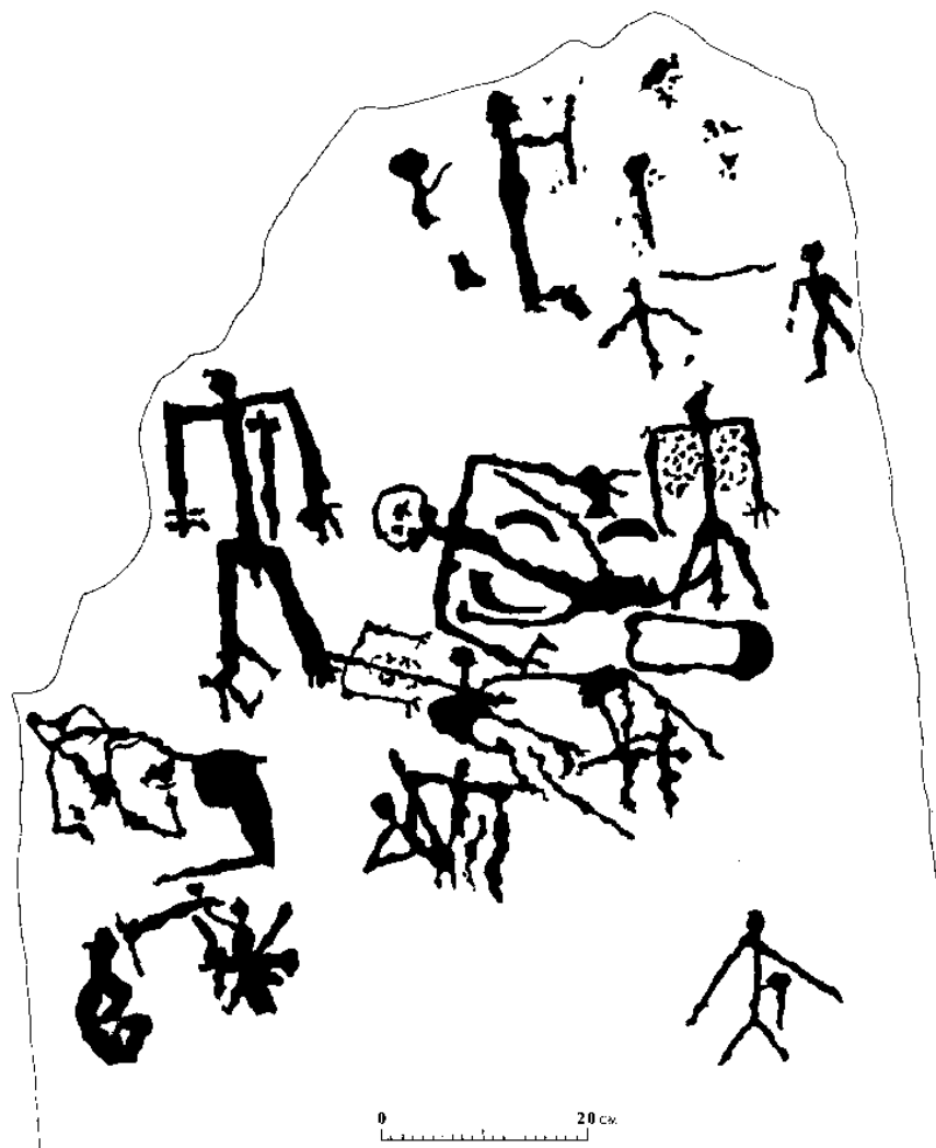
Рис. 3. Салбык. Петроглифы на одной из каменных плит.

“Цепочка” курганов в Салбыке ориентирована по линии северо-запад – юго-восток, по линии восхода и захода высокой Луны. Расположение курганов в Салбыке принципиально отличается от ориентации курганов за Саянским хребтом. Около поселка Аржан в Туве большие курганы (VI-V веков до нашей эры) сооружены по линии северо-восток – юго-запад и ориентированы по Солнцу – на высокую точку восхода в день летнего солнцестояния и низкую точку захода солнца в день зимнего солнцестояния. Таким образом, ориентировка цепочек курганов служит важным дополнительным (религиозным) критерием для двух ранее выделенных крупных зон археологических памятников.